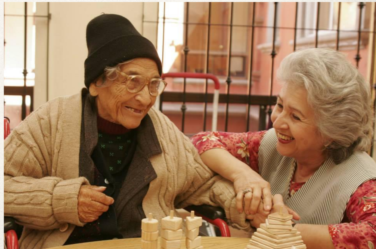
AIC Mexique : accompagne les personnes âgées facebook/AIC International