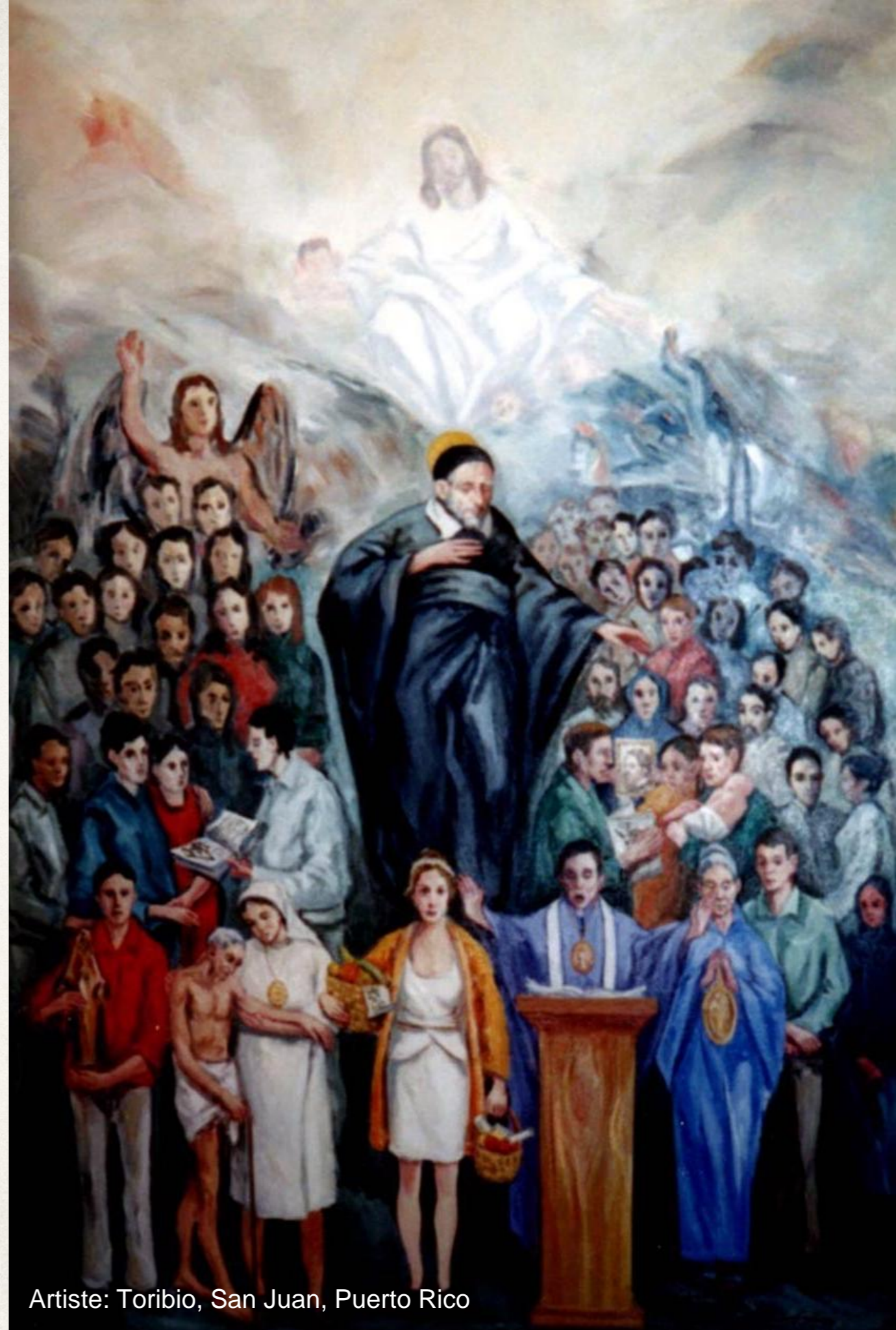
Artiste: Toribio, San Juan, Puerto Rico